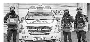
경북소방, 크리스마스 선물...119구급차서 새 생명 탄생