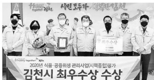
김천시, 식품·공중위생관리 최우수기관 선정