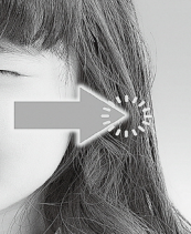
경북도 중소기업 청년 근로자 42% 이직 경험. 중소기업 청년 근로자 42% 이직 경험. 중소기업 청년 근로자 42% 이직 경험.