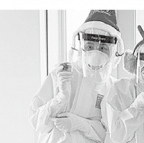
안동의료원 감염병전담병동의 ‘특별한 성탄절’