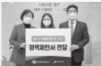
답서구에서는 행복공동체 만들기... 세종특별자치시 북부 행정지원부...