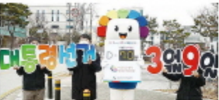
경북의 기업경기전망조사... 3월 2일부터 발표해스 전망

경북상공회의소가 2022년 1분기 기업경기전망조사에 대해 '암울' 전망...신규투자 '계획없다'