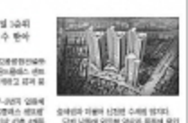
11월 17일 촬영, 11월 19일 개업 예정인 영대병원학 플랜트엑스 센터