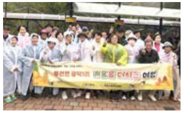
안동 광덕1리, 선진지 견학

안동시는 11월 1일, 안동시 풍천면 광덕1리 주민 25명과 함께 '이웃과 함께하는 배움을 더하는 여행'이라는 주제로 문경시에 선진지 견학을 다녀왔다고 밝혔다.