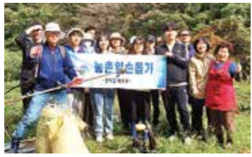
영덕 재무과, 농촌 일손 돕기

영덕군 재무과 직원 14명이 일손이 부족한 지역 농가를 돕기 위해 지난달 31일 병곡면에 있는 한 고추농가를 찾아 고추대 뽑기와 폐비닐 제거 등의 일손 돕기 봉사활동을 펼쳤다.