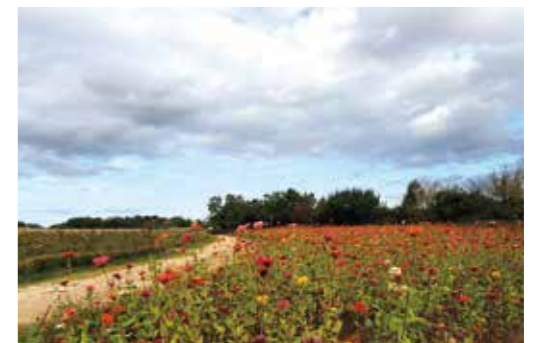
재는 배수시설 증설이 진행 중이다.

인덕산 자연마당은 총면적 18만 2,238㎡(55,000평)에 산철쭉 등 생태복원 식물 28만 3,101본을 식재하고 훼손된 역사군락의 자연천이를 유도하는 등 생태복원작업을 진행해 자연 친화적인 특화공간을 연출했다.