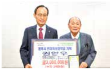
영주 장학회, 장학금 기탁

이날, 광덕1리 주민들은 문경시 이웃사촌복지센터 시범마을인과 곡리마을 주민과 만나 우수사례 등을 공유하고, 현장의 이야기를 생생하게 듣고 나누며, 이웃사촌 복지공동체의 견문을 넓히고 역량을 강화하는 뜻깊은 시간을 가졌다. 뿐만 아니라 울긋불긋 단풍으로 물든 문경오미자터널, 금천문화센터 등을 방문해 마을주민들이 함께 걷고 체험하며 가을의 정서를 온전히 만끽하는 행복한 추억을 쌓았다.